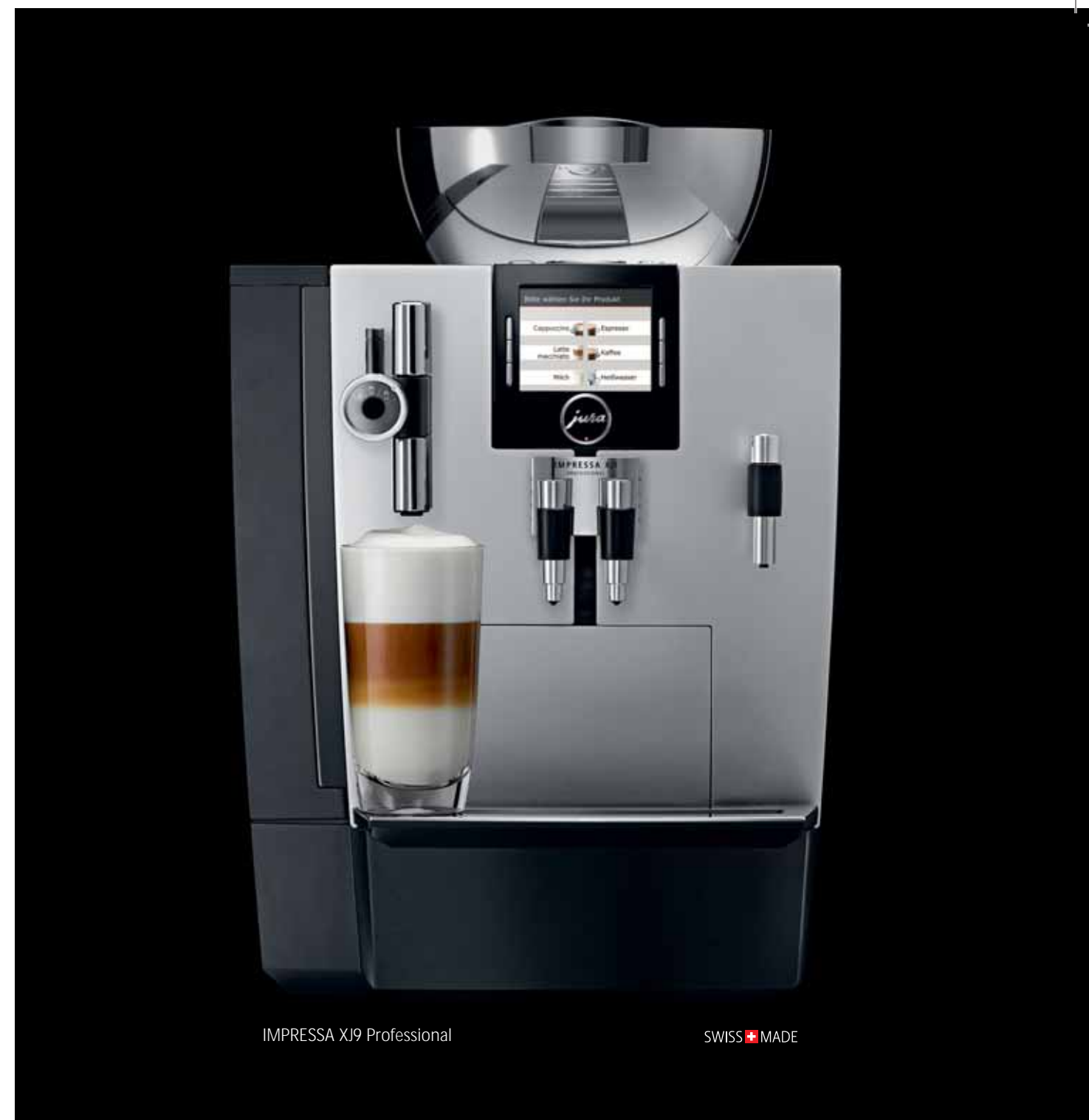
IMPRESSA XJ9 Professional

Registrierte IMPRESSA XJ-Kunden kommen in den Genuss eines exklusiven, neuen Servicekonzepts, das dem hohen Qualitätsstandard von JURA vortrefflich gerecht wird. Diese Dienstleistung stellt die Leistungsfähigkeit der professionellen Vollautomaten sicher und dient deren Werterhalt, 25 Monate oder 20.000 Bezüge lang. Dies beinhaltet z. B. zwei Inspektionen nach 9 und 18 Monaten beim Servicepartner.