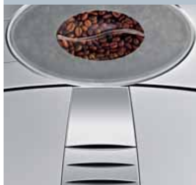
Klares Design in edlem Finish