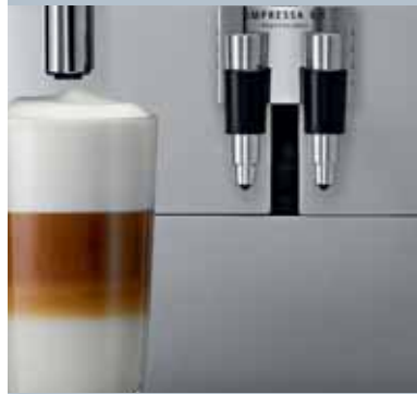
One Touch Cappuccino/ Latte macchiato