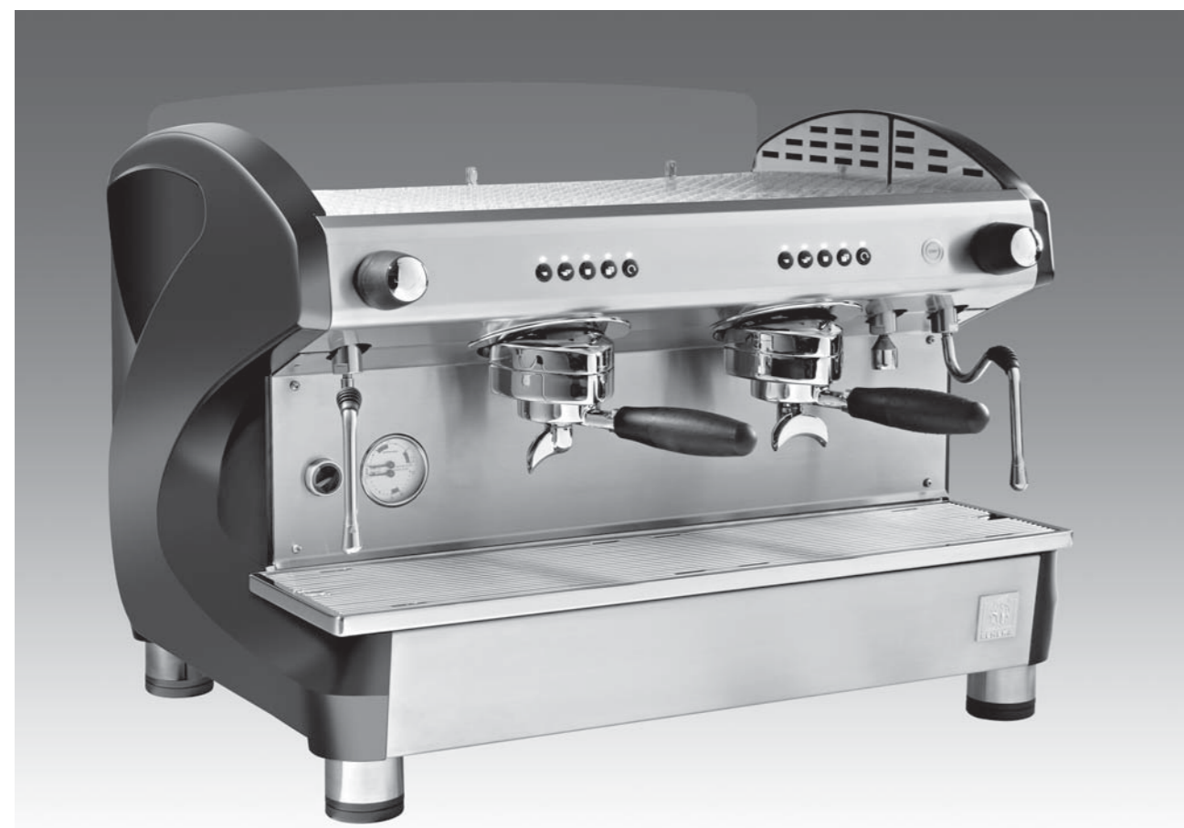
Farben: Dunkelgrau / „Piano“ Schwarz / „Piano“ Weiß – Verfügbar in 1, 2 und 3 Gruppen

Die VIVA-Technologie ergibt für Sie die beste Symbiose zwischen Verarbeitungsqualität, Zuverlässigkeit und Bedienerfreundlichkeit.