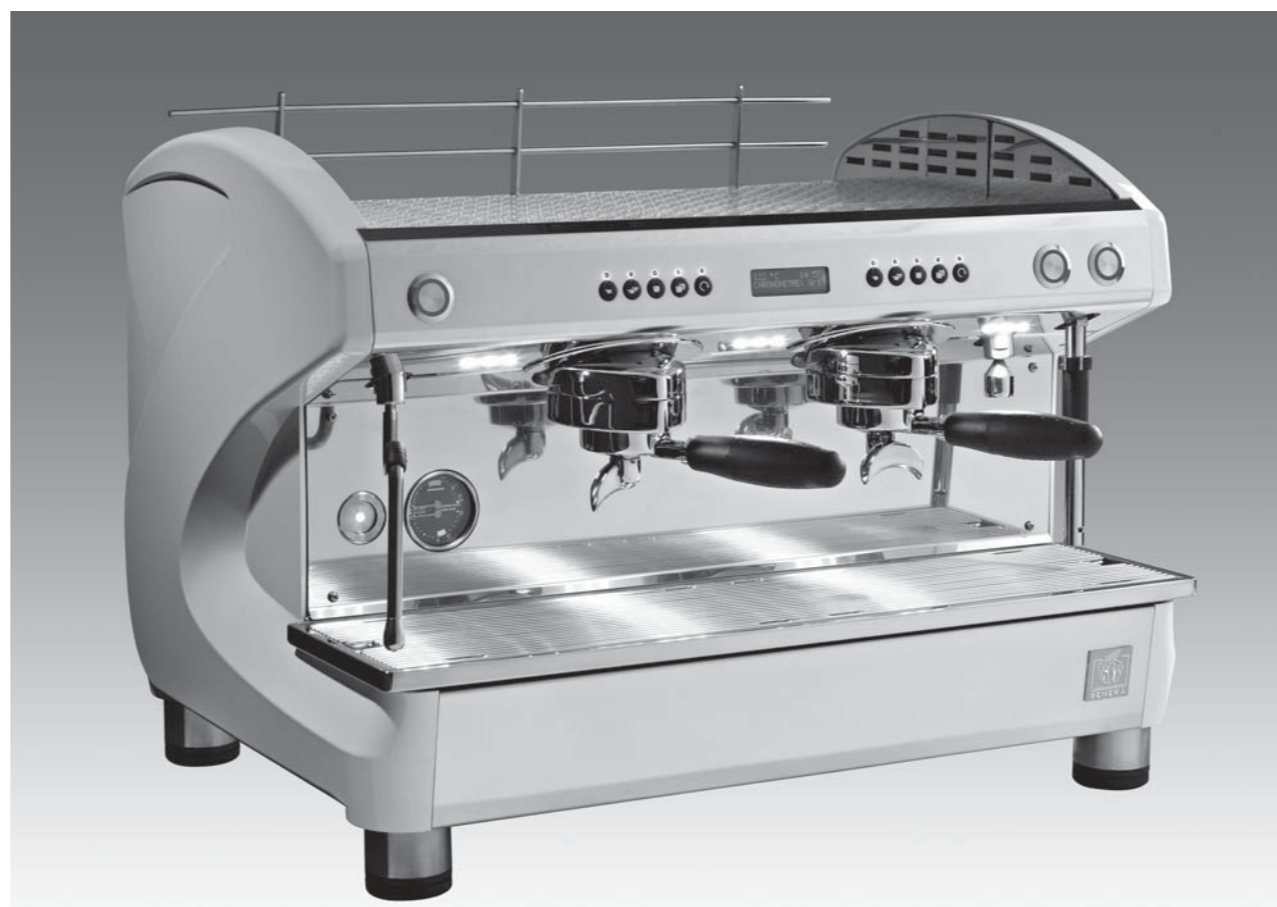
Farben: „Piano“ Schwarz / „Piano“ Weiß – Verfügbar in 1, 2 und 3 Gruppen

Die LIFE & LIFE HIGH CUP Espressomaschinen mit den neusten Technologien, Aroma Perfect, Micro Sieve & MultiCoffee System bieten gleichbleibende perfekte Extraktionsqualität sowie einfachstes Handling bei der Kaffeezubereitung.