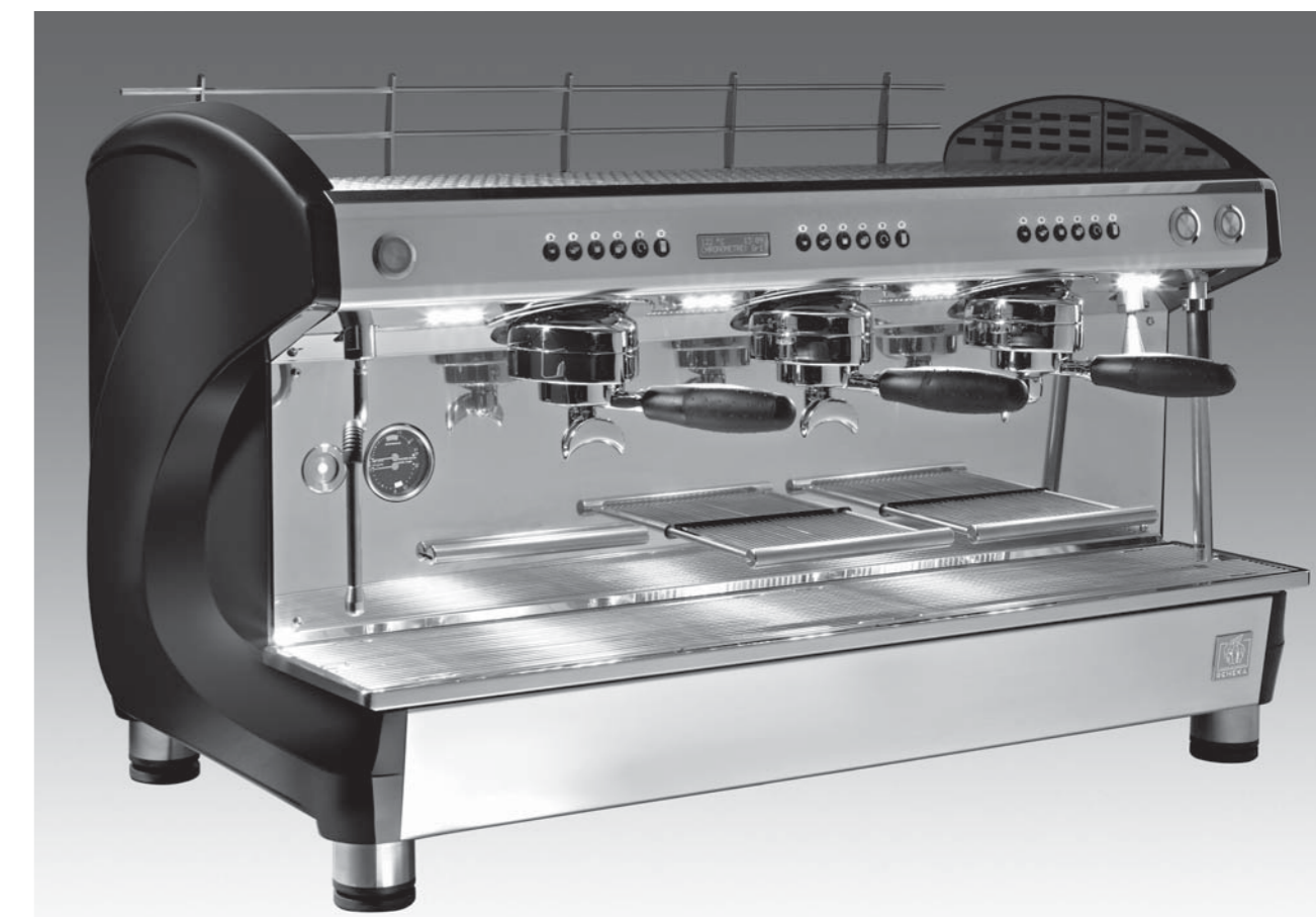
Farben: „Piano“ Schwarz / „Piano“ Weiß – Verfügbar in 2 und 3 Gruppen Ausziehbarer „Tassenabtropfst“, so dass Sie entweder in der Position „hohes Glas“ oder Standardhöhe arbeiten können